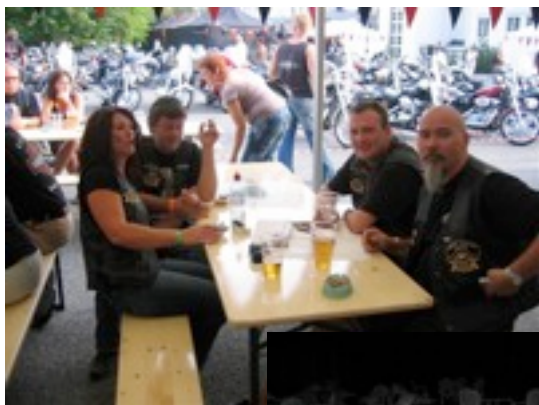
NOEN FIKK IDEER.....