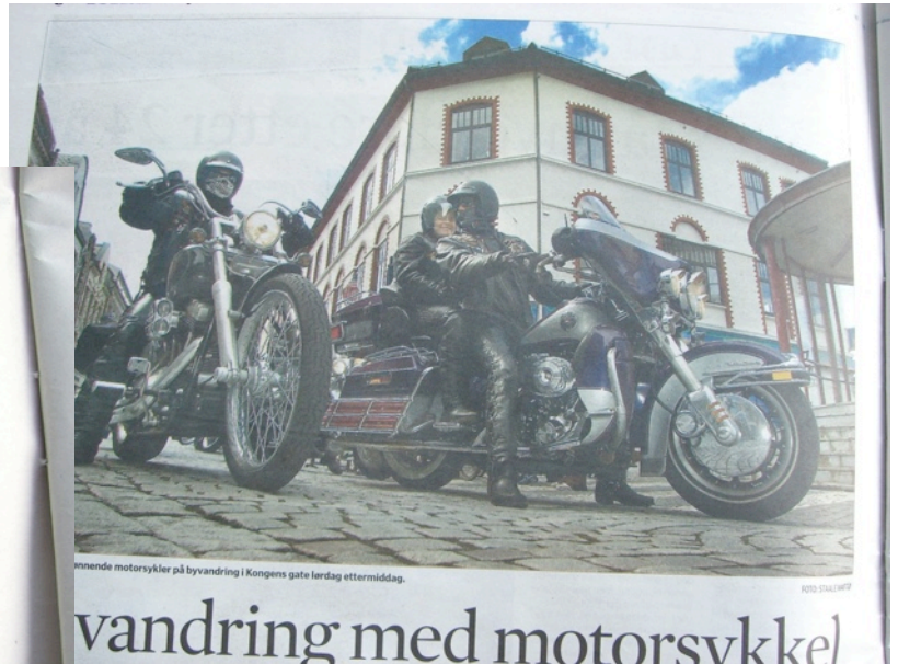
Drønnende motorsykler på byvandring i Kongens gate lørdag ettermiddag.